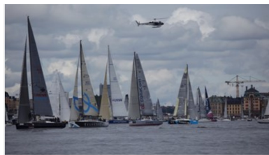
SJÄLVSTUDIER BLOCK 2

Ett sätt att spara lite tid, om det finns behov av det, är att låta deltagarna arbeta med självstudieavsnitt på egen hand mellan träffarna