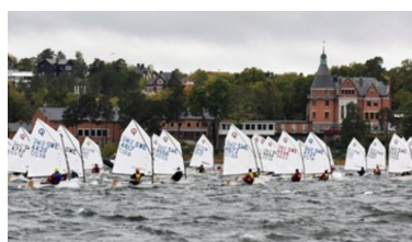
SJÄLVSTUDIER BLOCK 3