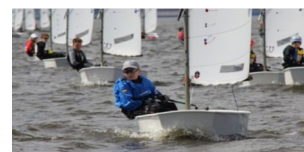
SJÄLVSTUDIER BLOCK 4 DEL 1

Här hittar du första delen av självstudier för block 4: När båtar möts