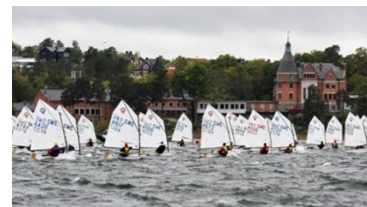
3. GENOMFÖRA EN KAPPEGLING

Titta på den inledande videon Seglingsföreskrifter. Efter detta avsnitt kan det vara bra att leta upp en seglingsföreskrift på Internet. Det kan du som lärgruppsledare ha förberett. Jämför sedan den seglingsföreskriften med standardseglingsföreskriften i KSR Appendix S. Diskutera vad ni tycker om seglingsföreskriften. Hur har arrangören lyckats? Är det enkelt att förstå hur kappseglingen ska genomföras?