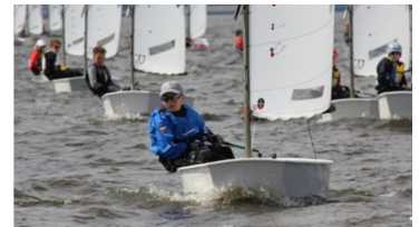
4. NÄR BÅTAR MÖTS

I det här blocket får du som lärgruppsledare bra vägledning av den text som finns i webbkursen före och efter varje videoavsnitt. När ni har tittat på de två första avsnitten, Rätt till väg 1 och Rätt till väg 2, så kan ni lämpligen gå till Självstudier Block 4 del 1. Där kan ni göra de 18-19 första bilderna, som handlar om definitioner samt reglerna 10, 11, 12 och 13.