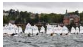
SJÄLVSTUDIER BLOCK 3

Gå igenom alla bilder som handlar om Genomföra en kappsegling och stanna sedan där. Resterande bilder i det självstudieavsnittet kan ni ta på nästa träff.