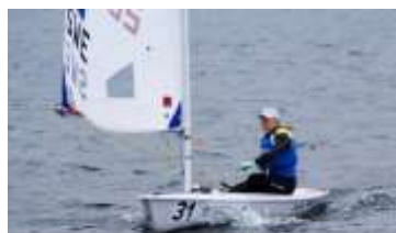
SJÄLVSTUDIER BLOCK 4 DEL 2

Gå nu vidare till resterande frågor och exempel i Självstudier Block 4 del 2.